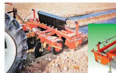
(D) PS 14 STAR